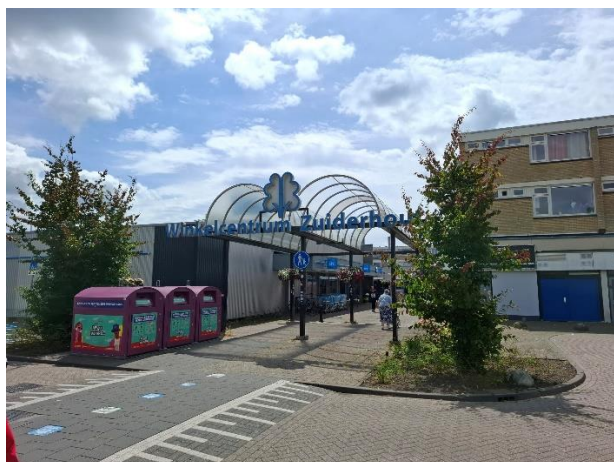
Locatie Overkapping aan van noordzijde winkelcentrum Zuiderhout

Sinds een aantal weken wordt, in opdracht van de eigenaar van het winkelcentrum (Portico), het winkelcentrum opgeknapt. Boeiboorden en (licht-)reclame worden/vervangen, ook de verouderde verlichting (aan de onderzijde van de winkeloverkapping) wordt vervangen door duurzamere Ledverlichting. Tegen deze achtergrond worden daarom ook de twee overkappingen in het winkelcentrum nu verwijderd, zodat het geheel weer fris en eigentijds oogt. Bij de werkzaamheden van de Burg. Holtropaan/ Vondellaan (2024) is de eerste overkapping verwijderd.