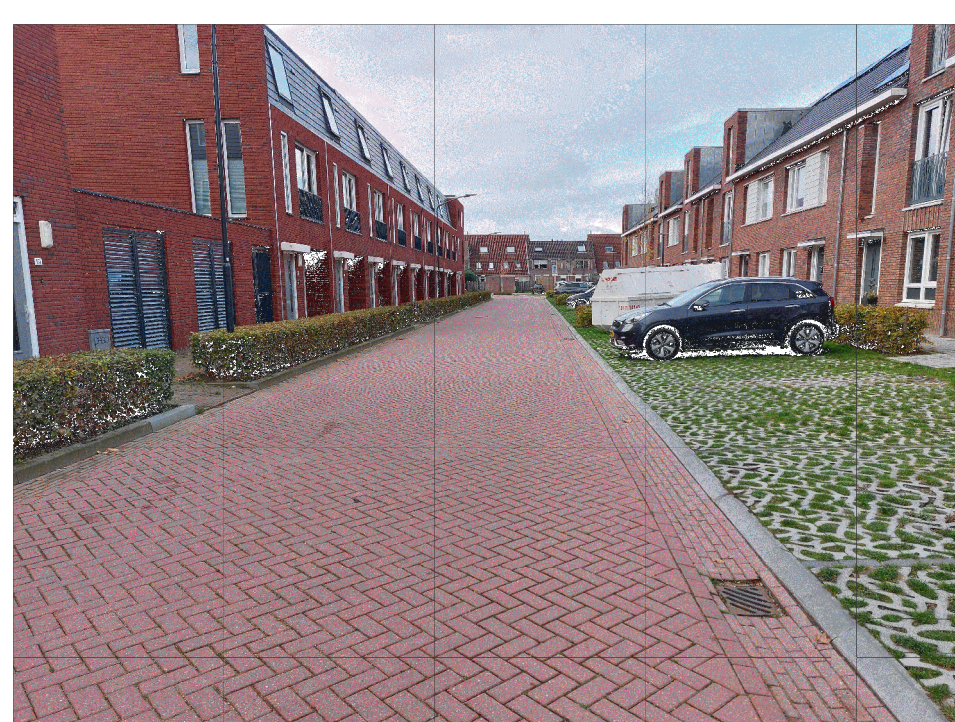
impressie GROENE PARKEERVAKKEN