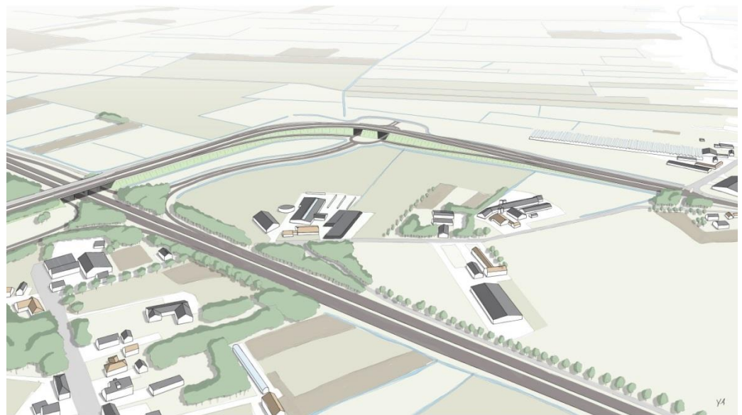
Figuur 1: Visualisatie oostelijke aansluiting N629 op rijksweg A27

Voor deze twee afzonderlijke delen van het project moeten de provincie en gemeenten verschillende procedures doorlopen. Voor het eerste deel, de aansluiting op de A27, is dat een bestemmingsplanprocedure, waarbij de gemeente Oosterhout bevoegd is om deze procedure te organiseren. Zij zijn het zogenaamde 'bevoegd gezag'.